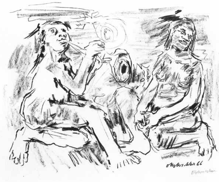
Oskar Kokoschka, Morgen und Abend (Macht der Musik), 1966

mances of Wolfgang Amadeus Mozart's „Zauberflöte“ at the Salzburg Festival and Giuseppe Verdi's „Maskenball“ at the opera festival Maggio Musicale Fiorentino in Florence were created in the 1950s and 1960s, with the painter being responsible for both the stage designs as well as the costume designs.