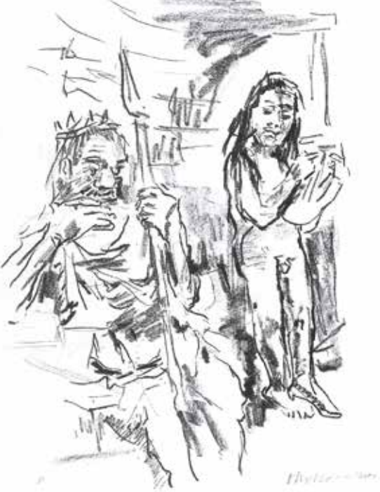
Oskar Kokoschka, David spielt Harfe vor Saul, aus: Saul und David, 1966/68