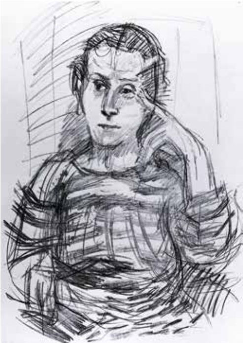
Oskar Kokoschka, Das Konzert V, 1920/21