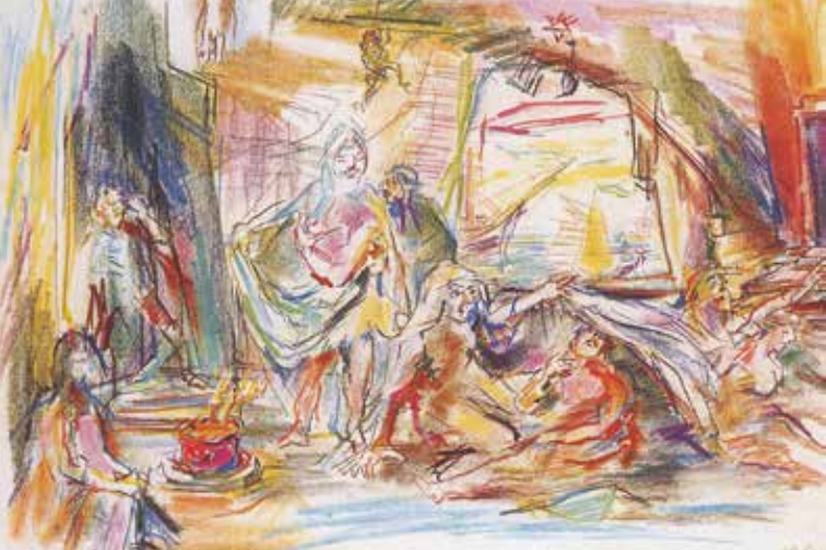
Oskar Kokoschka, Entwurf zu Verdis „Maskenball“, 1962