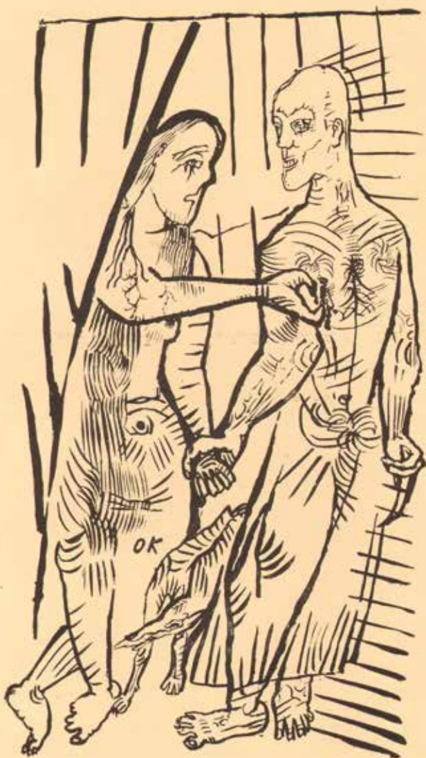
Oskar Kokoschka, Mörder, Hoffnung der Frauen, 1910 (1913)