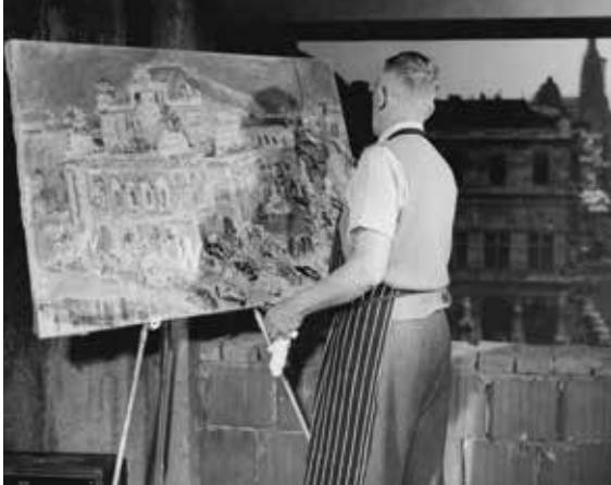
Oskar Kokoschka malt die Wiener Staatsoper vom gegenüberliegenden Rohbau des Opernringhofes, 1956