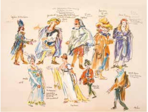
Oskar Kokoschka, Entwurf zu Verdis „Maskenball“, 1962