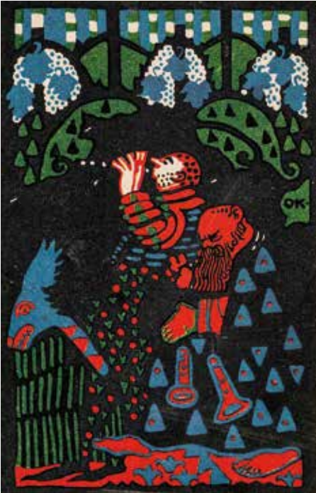
Oskar Kokoschka, Postkarte der Wiener Werkstätte, Musikanten (Nr. 76), 1907/08